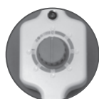
電源スイッチ (連続：60分タイマー)