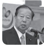
二階自民党総務会長

その後、日本鍼灸マッサージ協同組合総代会が開催され、議案はすべて原案通り承認可決された。