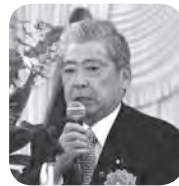
伊達参議院自民党幹事長