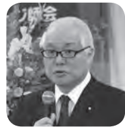
武見元厚労副大臣