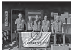
埼玉県鍼灸マッサージ師会