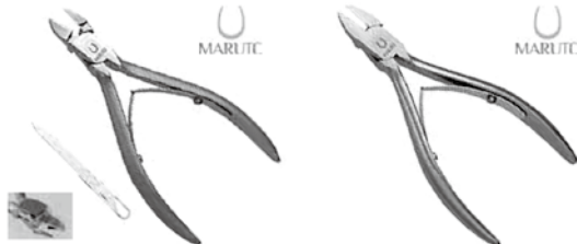
ネイルニッパー ネイルプロX ネイルニッパー ネイルプロII

お電話いただき次第、送料別途360円でお送りいたします。 在庫限りですので、ご注文はお早めに！