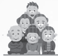
◀福島県師会の老人施設への活動にて (コロナ禍前)